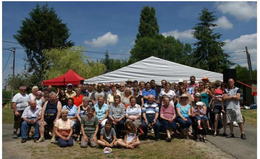
Fête des voisins Hameau Les Hâtes et Les Thiarris

C'est le samedi 20 juin 2015 que nous nous sommes retrouvés autour du pot de l'amitié sur la place de Grange-Pourrain. Nous étions une trentaine de personnes. Nous nous sommes remémorés les histoires de nos anciens, nous avons partagé nos plats divers et variés. Et après quelques refrains repris tous en chœur sous la houlette de notre barde local, nous nous sommes quittés en nous promettant de nous revoir l'année prochaine.