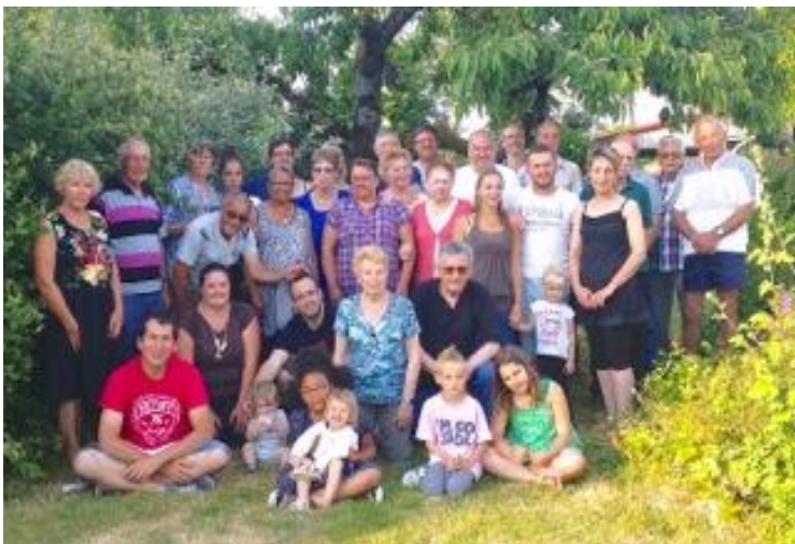
Fête des voisins Hameau Grange Bertin