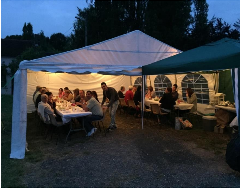
Fête des voisins Hameau Grange Pourrain

C'est le samedi 20 juin 2015 que nous nous sommes retrouvés autour du pot de l'amitié sur la place de Grange-Pourrain. Nous étions une trentaine de personnes. Nous nous sommes remémorés les histoires de nos anciens, nous avons partagé nos plats divers et variés. Et après quelques refrains repris tous en chœur sous la houlette de notre barde local, nous nous sommes quittés en nous promettant de nous revoir l'année prochaine.