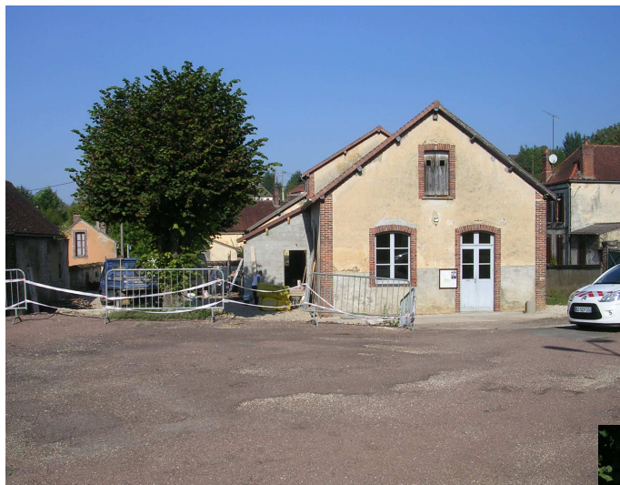
Cuisine salle des fêtes