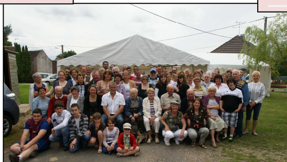
Les Hâtes 15 et 16 juin 2013