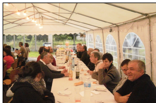
Grange Pourrain 22 juin 2013