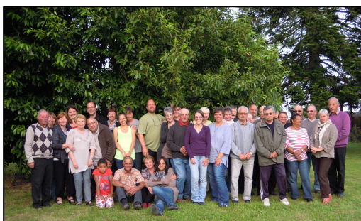
De l'Enfourchure à Vaucrechot 29 juin 2013