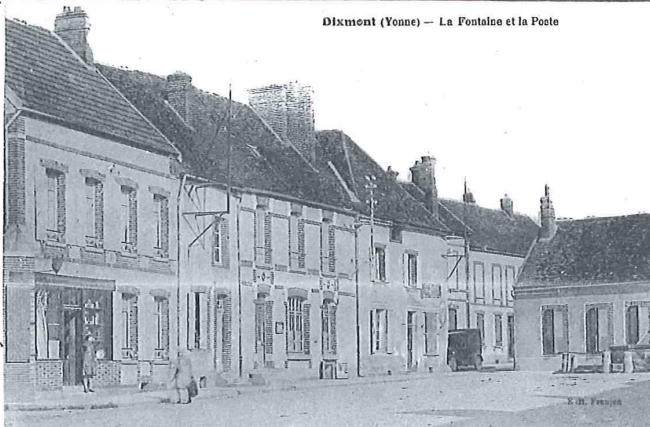
Dixmont (Yonne) - La Fontaine et la Poste

Le Maire à la suite de cette lettre, estimant que M r le Sous-Préfet n'a pas accepté sa démission et satisfac- tion lui étant accordée, accepte de retirer sa démission